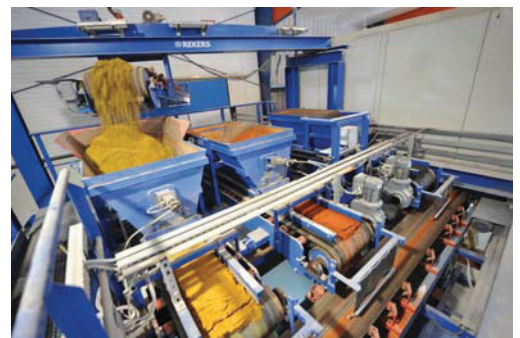
Steinformmaschine KRS 4

z. B. Englisch und Kyryllisch, ist aufgrund des Vertragscharakters der Dokumente ebenfalls vorgesehen.