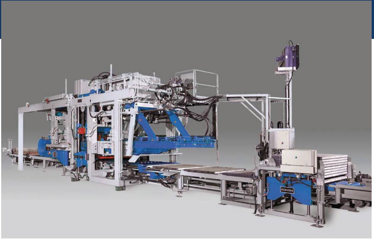
Steinformmaschine KRS 4 für Kern- und Vorsatzbeton mit Hydraulikantrieb

Rekers GmbH ist Spezialist für den Maschinen- und Anlagenbau zur Herstellung von Betonprodukten.