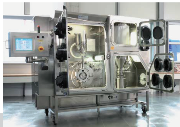
Isolator mit integrierter Mahlanlage