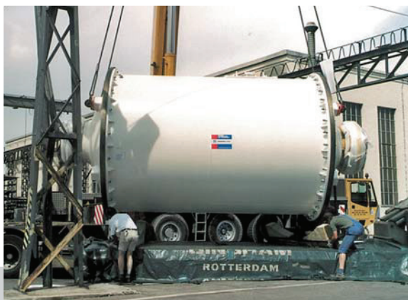
Verladung einer Kugelmühle Super-Orion S.O.