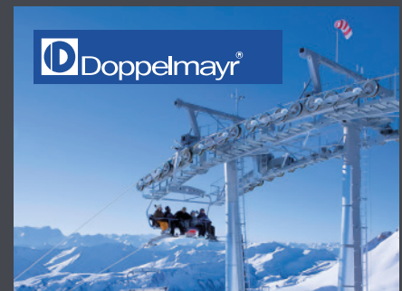
Wolfurt, Österreich DOPPELMAYR SEILBAHNEN GmbH