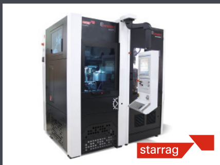
Chemnitz STARRAG GmbH