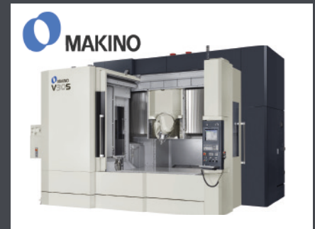
Kirchheim unter Teck MAKINO EUROPE GmbH