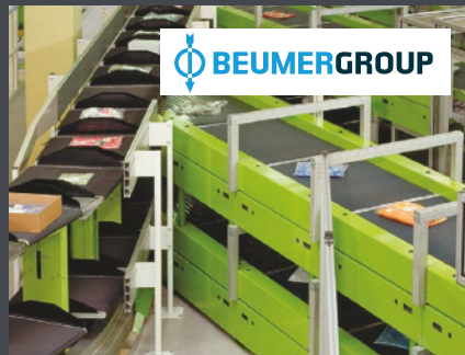
Beckum BEUMER GROUP GmbH & Co. KG