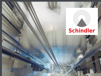
Ebikon, Schweiz SCHINDLER ELEVATOR Ltd.