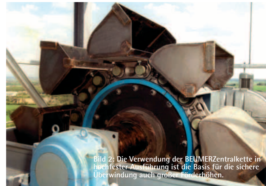
Bild 2: Die Verwendung der BEUMERZentralkette in höchster Ausführung ist die Basis für die sichere Überwindung auch großer Förderhöhen.

Leegoo Builder erlaubt einen Start im Angebotswesen nahezu "aus dem Stand", indem die bestehenden Ange-