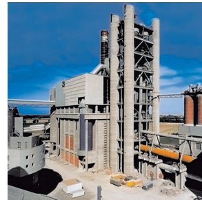
Becherwerk am Vorwärmerturm einer Zementfabrik

Für Stammkunden wird die LEEGOO BUILDER Option Kundenkonfigurator eingesetzt. Damit können BEUMER