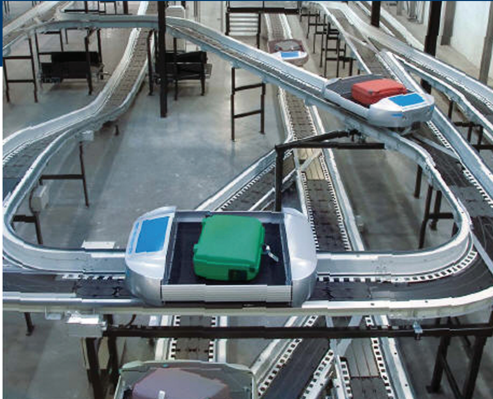
BEUMER autover® System