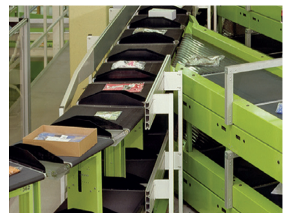
BEUMER Belt Tray Sorter